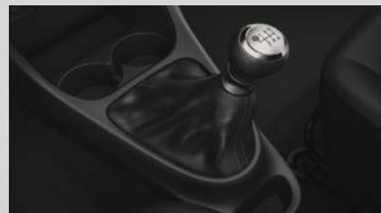
Caja manual de 6 marchas.