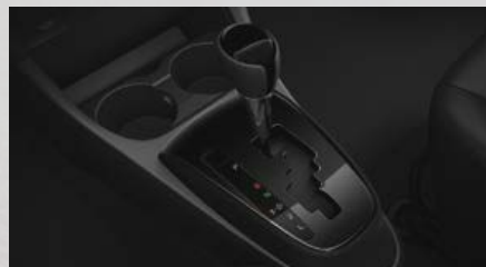
Caja automática de 4 marchas. (1)