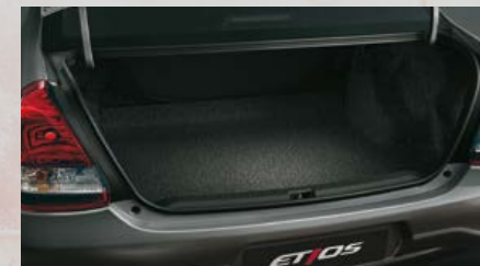
Capacidad de carga de baúl: 562 litros. (2)