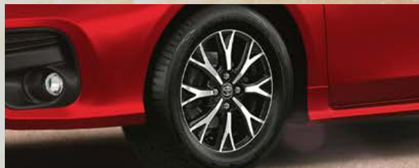
Llantas de aleación diamantadas. (1)