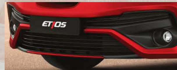
Faros antiniebla delanteros. (1)