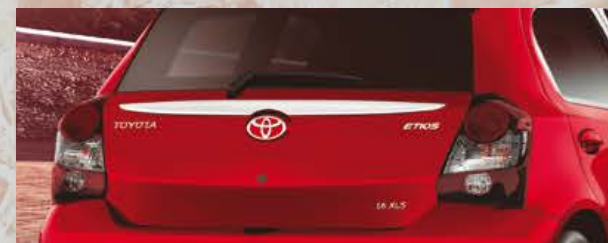
Moldura trasera cromada. (1)