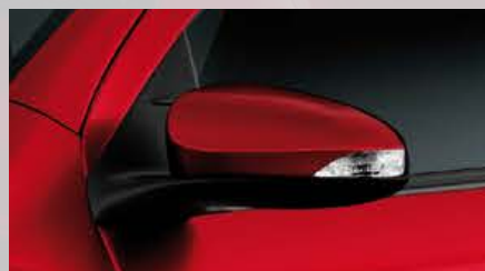
Espejos exteriores con luz de giro incorporada y regulación eléctrica. (3)