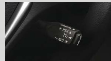
Control de velocidad crucero. (1)