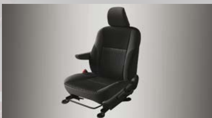
Asiento del conductor con apoyabrazos. (1)