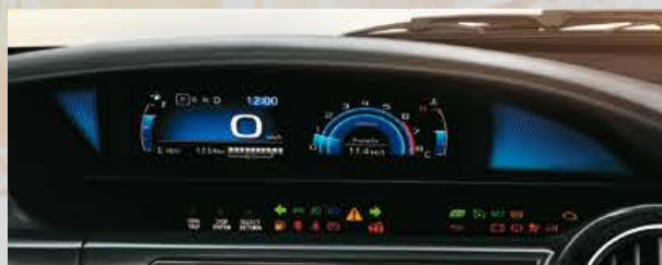
Display de información múltiple digital.