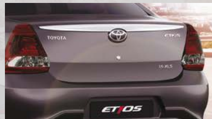
Apertura interior de baúl y tanque de combustible. (2)