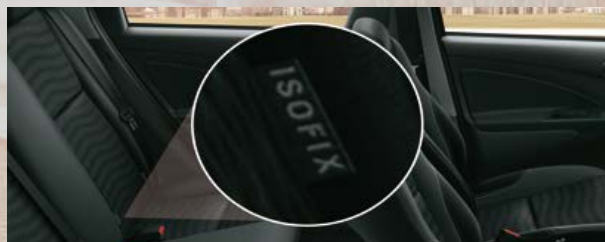
Anclaje ISOFIX (x2) en asiento trasero.