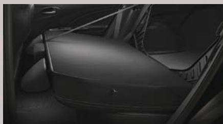
Asiento trasero rebatible.