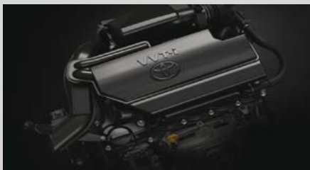
Motor Toyota 2NR-FE, 16 válvulas con sistema dual VVT-i.