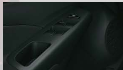
Levanta cristales eléctricos en las 4 puertas.