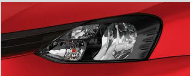
Faros oscurecidos. (1)