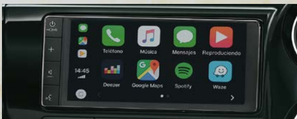
Audio con pantalla táctil LCD de 7", con conectividad: Apple CarPlay® y Android Auto®. (1) *