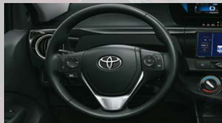
Volante de cuero con control de audio, display de información múltiple y teléfono. (3)