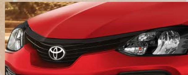
Parrilla con detalle color negro. (1)